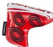
DOUBLE WIDE, DOUBLE WIDE S