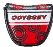
R-BALL, R-BALL S