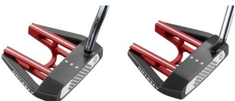
ダブルバウンドネック