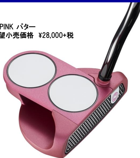
O-WORKS PINK パター メーカー希望小売価格 ¥28,000+税