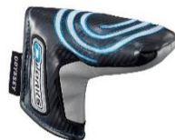
#1, #1W SH