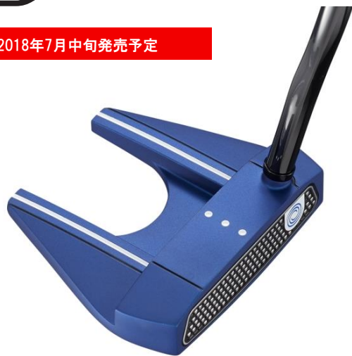
O-WORKS BLUE パター メーカー希望小売価格 ¥28,000+税